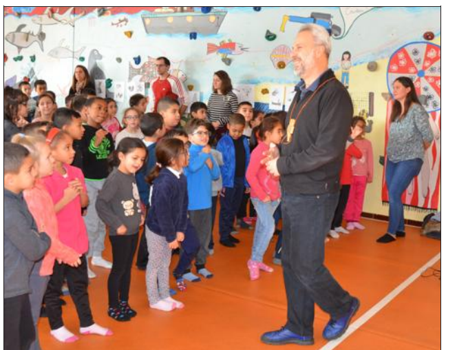
Le metteur en scène est satisfait du très bon travail fait par les enfants sur “La Flûte enchantée” de Mozart.