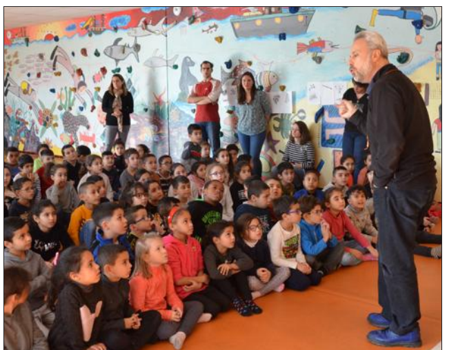
Le baryton conseille les enfants de l'école Jacques-Yves Cousteau de Pont-Évêque, à l'écoute.